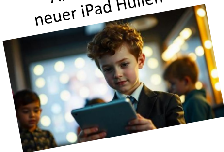
Anschaffung neuer iPad Hüllen