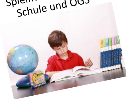
Lern- und Spielmaterialien für Schule und OGS