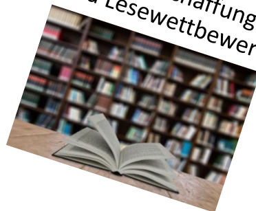
Bücheranschaffungen und Lesewettbewerb